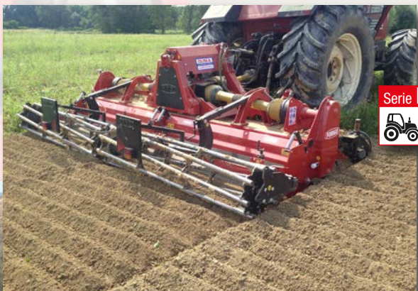
Serie DG35 HP 120÷200 kW 89÷148