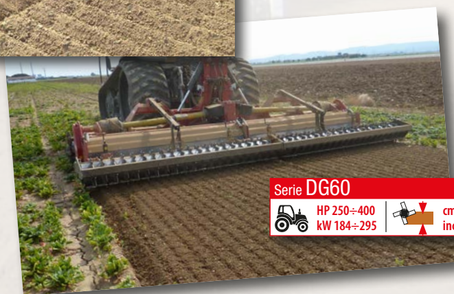
Serie DG60 HP 250÷400 kW 184÷295