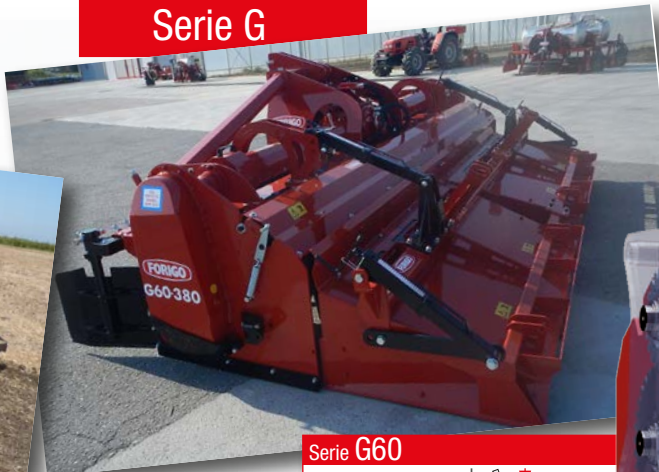
Serie G60 HP 200÷400 kW 148÷295