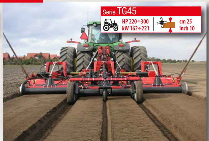
Serie TG45 HP 220÷300 kW 162÷221