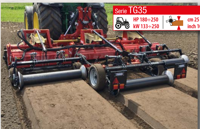
Serie TG35 HP 180÷250 kW 133÷250