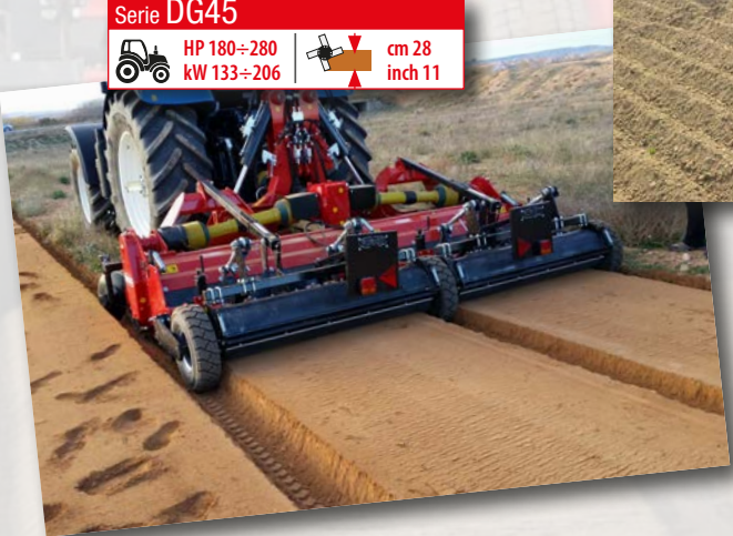
Serie DG45 HP 180÷280 kW 133÷206