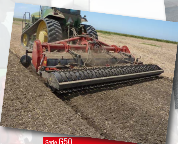
Serie G50 HP 150÷300 kW 111÷221

Trasmissione a 6 ingranaggi Transmission driven by 6 gears