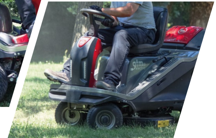
Frontlenkung mit Zahnstangensystem