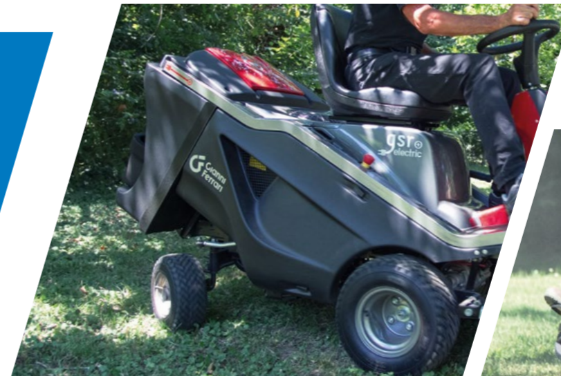
Hecklenkung mit Zahnstangensystem