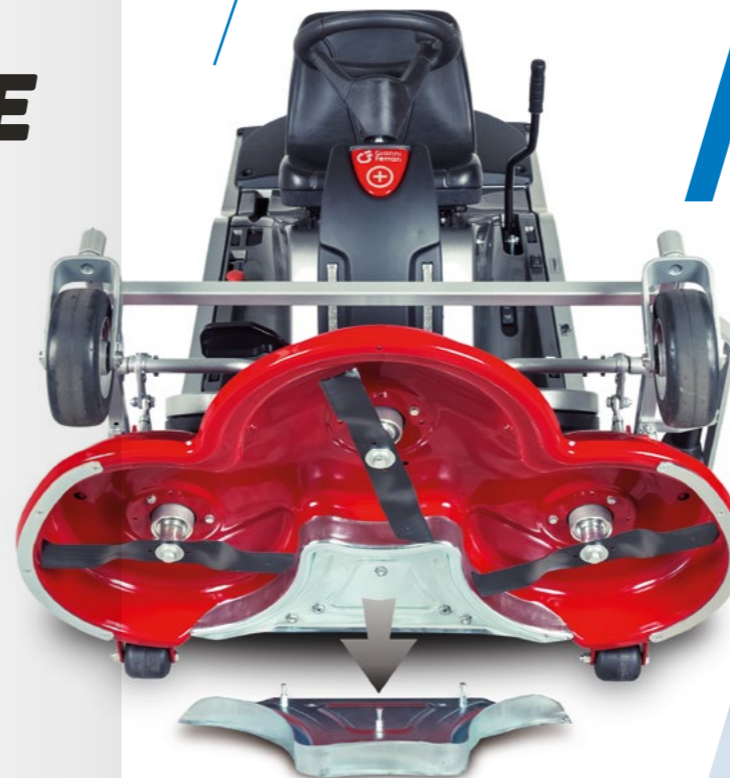
Entfernbarer Platte für Heckauswurf

Zum Mulchmähwerk des GSR+ Electric kann sehr einfach auch der HECKAUSWURF hinzugefügt werden. Der Aluminium-Deckel unter dem Mähwerk kann mit einem federbelasteten Hebel auf der rechten Seite des Mähwerks (Fahrerseite) einfach entnommen werden.