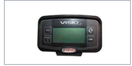
IT: Visualizzatore digitale di pressione e/o altri dati / EN: Digital display for pressure and/or other data / FR: Affichage digital pour pression ou d'autres données / DE: Digitale Anzeige für Druck oder andere Daten / ES: Pantalla digital para presión u otros datos