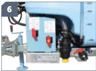
6 IT: Valvola di non ritorno sul risciacquo (su portati) / EN: Non-return valve on rinsing device (on mounted versions) / FR: Rinçage Ecoplus (sur portés) / DE: Rückschlagventil Spülsystem (bei aufgesattelten Modellen) / ES: Válvula de no retorno para el enjuague (en versiones suspendidas)