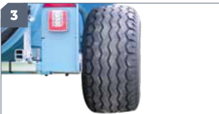
IT: Ruote larghe / EN: Wider wheels / FR: Roues larges / DE: Breite Räder / ES: Ruedas anchas