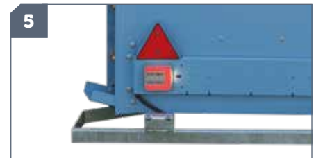
IT: Kit fanali / EN: Lights set / FR: Rampe d'éclairage / DE: Rückleuchten-Beleuchtung / ES: Kit luces

⚠ IT: NON utilizzabile in caso di omologazione stradale / EN: NOT suitable for road approval / FR: NE convient pas à l'homologation routière / DE: NICHT für die Straßenzulassung geeignet / ES: NO adapto para homologación vial