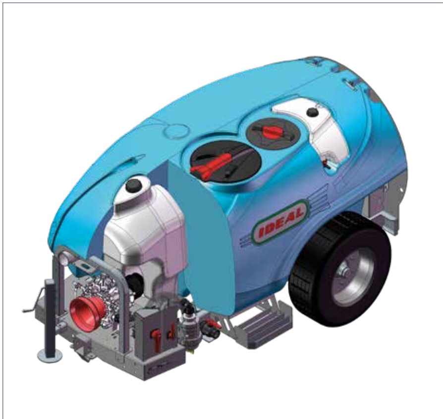
IT: Versione trainata / EN: Trailed version / FR: Modèle tracté / DE: Gezogene modelle / ES: Versión arrastrada