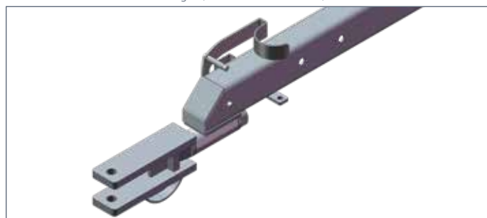
IT: Timone a forcella / EN: Clevis drawbar / FR: Attelage a chappe / DE: Deichsel mit Anhängegabel / ES: Tiro de forquilla