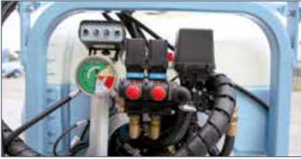
IT: Kit valvole elettriche / EN: Electric valves set / FR: Kit vanne électriques / DE: Kit Elektro-Bedienungseinheit / ES: Kit válvulas eléctricas

CONTROL DEVICES AND COMPUTERS | COMMANDE ET ORDENATEURS ELEKTRISCHE BEDIENUNGSANHEIT UND COMPUTER | MANDOS Y ORDENADORES