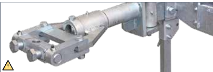
IT: Timone sterzante con cuscinetti tipo Germania / EN: Tracker drawbar with bearings "German type" / FR: Attelage articulé monté sur roulement modèle Germania / DE: Lenkdeichseln mit Lager Germania Modell / ES: Tiro articulado con cojinetes tipo Alemania