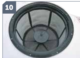
10 IT: Premiscelatore a doccia / EN: Showering pre-mixer for powders / FR: Mélangeur de poudre a douche / DE: Einfüllsieb Dusche Zerstäuber / ES: Pre-mezclador a ducha