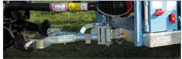
IT: Timone articolato con cuscinetti / EN: Tracker drawbar with bearings / FR: Attelage articulé avec roulements / DE: Gelenkdeichsel mit Lager / ES: Tiro articulado con cojinetes