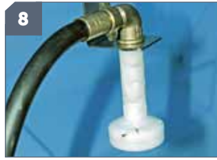
8 IT: Lavacisterna / EN: Tank cleaner / FR: Dispositif de rinçage du réservoir / DE: ankreiniger / ES: Lavadepósito