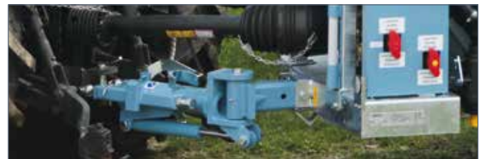
IT: Timone sterzante omologato stradale/bloccaggio idraulico (optional) / EN: Tracker drawbar for road approval/hydraulic lock (optional) / FR: Attelage articulé routier/option blocage hydraulique / DE: Lenkdeichsel für verkehrszugelassene Maschinen (hydraulische Blockierung-Option) / ES: Tiro articulado para homologación de carretera/bloqueo hidráulico (opcional)