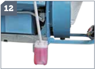
12 IT: Incorporatore aspirante di prodotti a tubo / EN: Sucking device for chemicals with pipe / FR: Incorporateur de poudre avec tuyau / DE: Spritzmittel-Einfüllschleuse mit Schlauch / ES: Incorporador aspirante de productos con caño