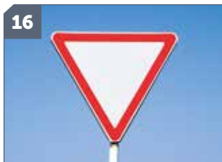
16 IT: Omologazione stradale / EN: Road approval / FR: Homologation routiere / DE: Straßenzulassung / ES: Homologación vial