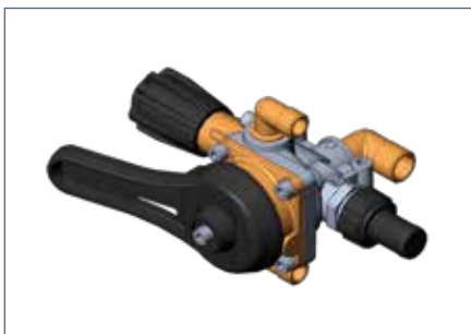
IT: Comando manuale in ottone / EN: Manual brass control / FR: Commande manuelle en laiton / DE: Manuelle bedienungsanheit aus messing / ES: Mando manual de latón