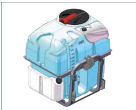
IT: Versione portata / EN: Mounted version / FR: Modèle porté / DE: Aufgesattelte modelle / ES: Versión suspendida