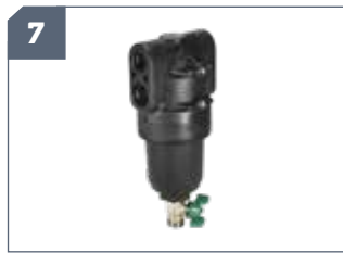
7 IT: Filtro alta pressione / EN: High pressure filter / FR: Filtre haute pression / DE: Hochdruckfilter / ES: Filtro de alta presión