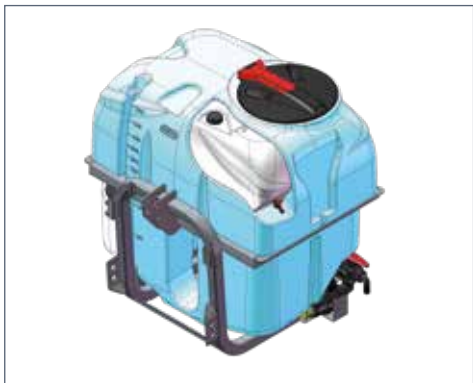
IT: Versione portata / EN: Mounted version / FR: Modèle porté / DE: Aufgesattelte modelle / ES: Versión suspendida

STANDARD EQUIPMENT | EQUIPEMENT STANDARD | STANDARDAUSRÜSTUNG | DOTACIÓN ESTÁNDAR