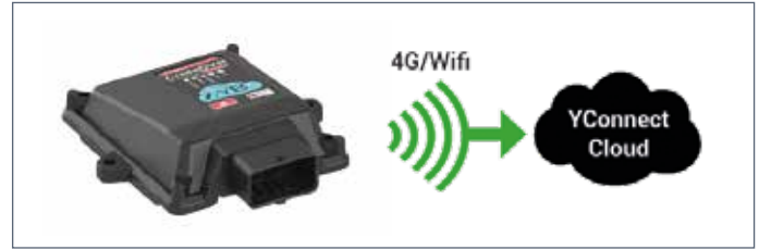
IT: Sistema per monitorare e gestire il parco macchine da remoto (Agricoltura 4.0) / EN: System for remote control and management of sprayers / FR: Système de contrôle et de gestion à distance des pulvérisateurs / DE: System zur Fernsteuerung und Verwaltung von Sprühgeräten / ES: Sistema de control y gestión a distancia de los pulverizadores