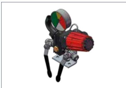
IT: Comando manuale / EN: Manual control / FR: Commande manuelle / DE: Manuelle bedienungsanheit / ES: Mando manual