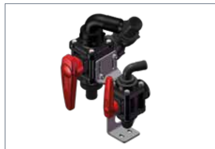
IT: Valvola di non ritorno sul risciacquo (su trainati) / EN: Non-return valve on rinsing device (on trailed versions) / FR: Rinçage Ecoplus (sur tractés) / DE: Rückschlagventil Spülsystem (bei gezogenen Modellen) / ES: Válvula de no retorno para el enjuague (en versiones arrastradas)