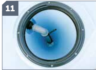
11 IT: Incorporatore aspirante di prodotti / EN: Sucking device for powders / FR: Incorporateur de poudre / DE: Spritzmittel-Einfüllschleuse / ES: Incorporador aspirante de productos