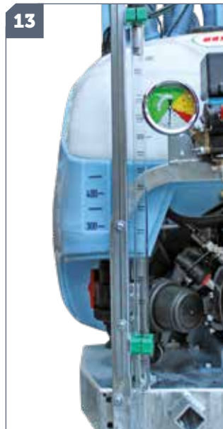
13 IT: Indicatore livello serbatoio a secco / EN: Dry gauge for tank level / FR: Jauge seche / DE: Tankpegelmesser (trocken) / ES: Indicador de nivel