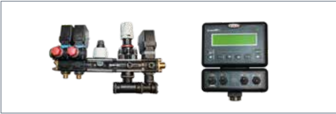
IT: Computer per una distribuzione proporzionale all'avanzamento / EN: Computer for a liquid supply proportional to driving speed / FR: Ordenateur pour une distribution de liquide proportionnelle à la vitesse de conduite / DE: Computer für eine Flüssigkeitsverteilung proportional zur Fahrgeschwindigkeit / ES: Ordenador para un suministro proporcional a la velocidad