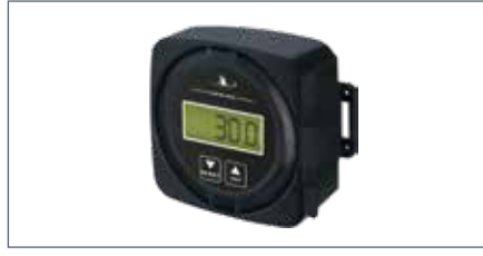
IT: Visualizzatore digitale della sola pressione / EN: Digital display for pressure only / FR: Affichage digital pour pression / DE: Digitale Anzeige nur für Druck / ES: Pantalla digital para presión solamente