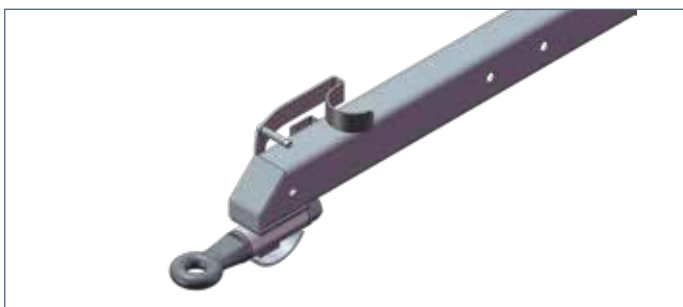
IT: Timone a occhione / EN: Ring drawbar / FR: Attelage a oeil / DE: Deichsel mit Öse / ES: Tiro con gancho de arrastre