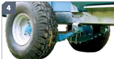
IT: Kit balestre / EN: Leaf springs set / FR: Kit suspension a lames de ressort / DE: Kit Blattfedern / ES: Kit ballestas