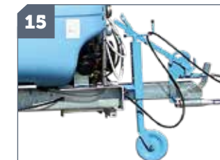
15 IT: Ruotino appoggio / EN: Touring wheel / FR: Support Béquille jockey / DE: Stützrad / ES: Rueda de apoyo